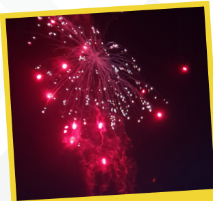
Fête du 14 Juillet