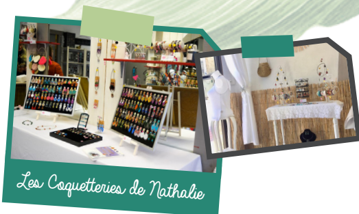
Les Coquetteries de Nathalie

À l'intérieur de la boutique, vous retrouverez ainsi une multitude de boucles d'oreilles, de bracelets, de broches, de châles ou encore de sacs à main. Autant de fantaisies à petits prix et à découvrir jusqu'au 31 décembre 2020 !