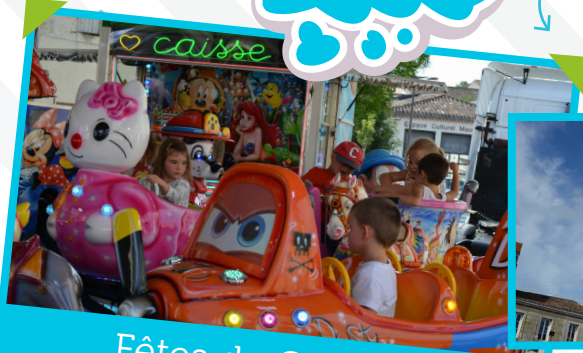
Fêtes de Coutras

Cet été, Coutras a bougé ! Synonymes de partage et de convivialité, les Fêtes de Coutras du 3 au 5 juillet, la Fête du 14 juillet, les marchés gourmands et scènes d'été du 23 juillet et du 13 août, la Fête du Fagnard du 22 au 23 août et le cinéma en plein-air du 29 août ont, une fois de plus, animé le cœur de ville pour notre plus grand bonheur.