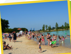
Lac des Nauves